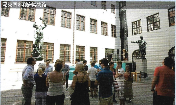
马克西米利安博物馆