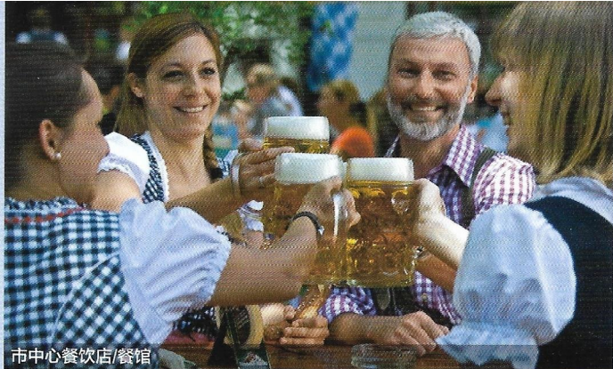
市中心餐饮店/餐馆