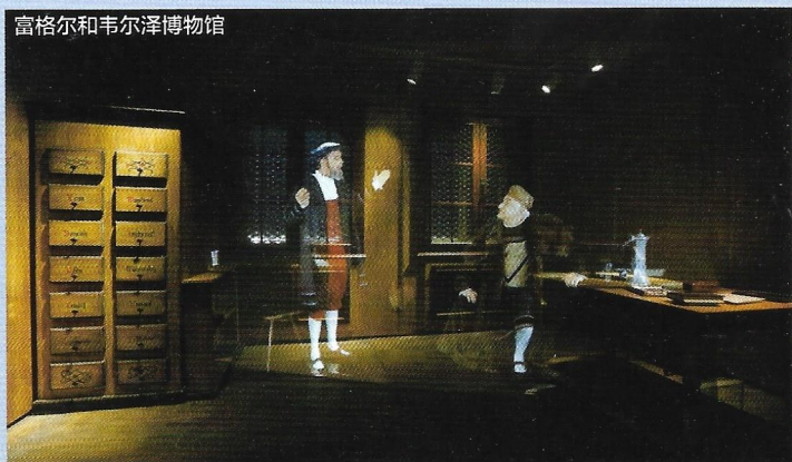
富格和韦尔泽博物馆

L 犹太教堂 (Synagoge): 犹太教堂是1914年至1917年由海因里希·吕珀尔和弗里茨·兰道尔建造的，是一个圆顶建筑，部分设施带有新艺术风格。建筑群里还有犹太文化博物馆。