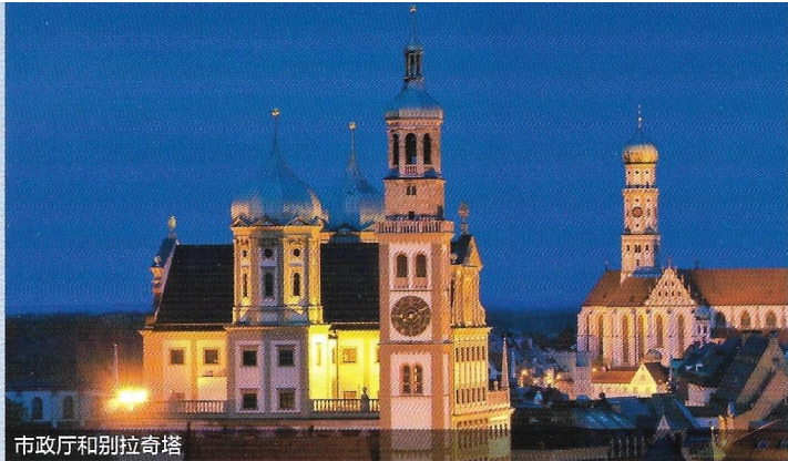
市政厅和别拉奇塔