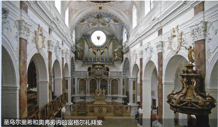
圣乌尔里希和奥弗劳内的富格尔礼拜堂

方案、文字、设计：奥格斯堡具体策划广告公司 | 照片：Wolfgang B. Kleiner (1), Martin Kluger (14), Norbert Liesz (1), Friedrich Stetmeyer (1) | 所有的说明不能保证完全正确 | 版本：2016 年10月